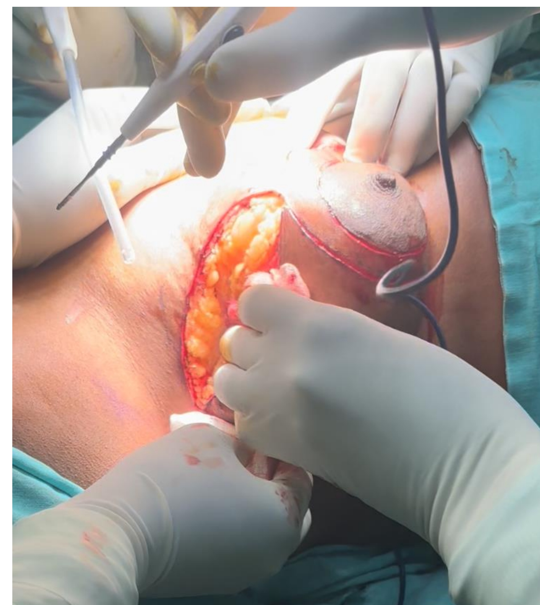
Dufourmentel, Per opératoire