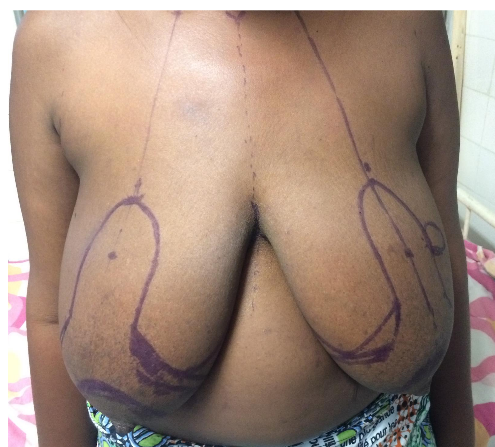
Dessin Patron de Wise